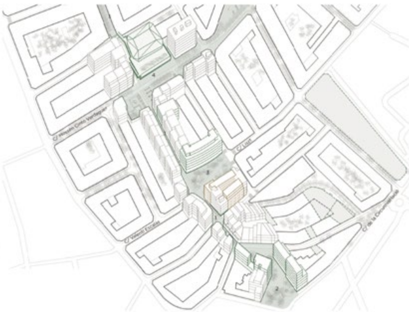
Proyecto de renovación urbana de los barrios de la Serra d'en Mena en Santa Coloma de Gramenet. Eje Bruc

Otra de estas pequeñas actuaciones con gran capacidad de regenerar y activar económicamente pequeños fragmentos de ciudad es la del barrio de Torrassa-Collblanc de l'Hospitalet de Llobregat: un barrio configurado con la estructura urbana heredada del pasado agrícola, con parcelas estrechas y pequeñas, caracterizado por la densidad elevada, calles estrechas, déficit de zonas verdes y falta de equipamientos. Durante los últimos años, la llegada masiva de población extranjera al barrio se ha visto acompañada de un proceso de degradación de la edificación y dinámicas de segregación urbana. La nueva actuación ha consistido en la demolición de viviendas en mal estado y la construcción de 92 viviendas protegidas, algunas de ellas destinadas al realojo de los vecinos de la zona, además de locales comerciales y un equipamiento a cargo del Ayuntamiento. La operación consigue la revitalización del tejido urbano, social y económico, así como la mejora de la calidad de vida de los vecinos originales y la llegada de nuevos perfiles sociales al barrio.