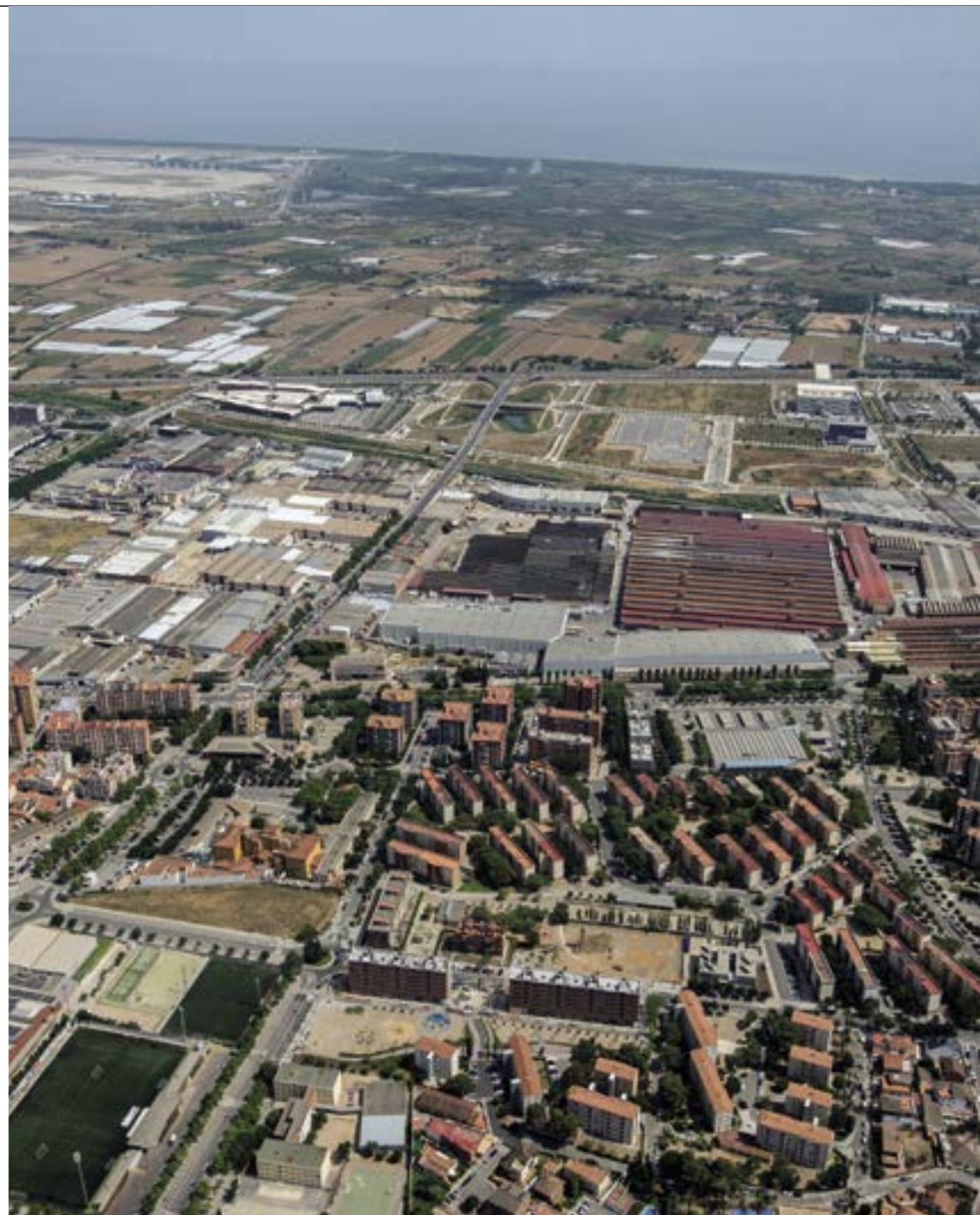
Imatge aèria del municipi de Viladecans amb el parc agrari del Delta del Llobregat al fons, ambdós entre diferents àrees industrials i d'activitat econòmica com ca n'Alemanya

A partir d'aquesta premissa, d'una primera aproximació a l'àrea en qüestió i valorant els diferents buits amb possibilitat de desenvolupament, resulten diversos àmbits que s'han de tenir en compte per a futures implantacions d'activitat econòmica, en concret cinc àmbits repartits en quatre municipis (Gavà, Viladecans, Castelldefels i Sant Boi de Llobregat). La inclusió d'aquests cinc àmbits respon a la seva capacitat d'acollir empreses i activitats que tenen una importància més enllà de l'àmbit de l'economia local d'aquests municipis.