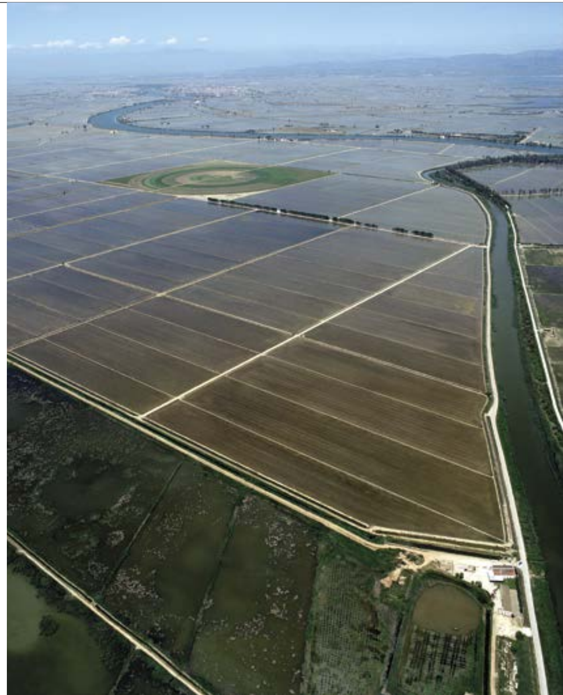
Vista aèria de l'àrea de recuperació ambiental de la finca el Violí al delta de l'Ebre