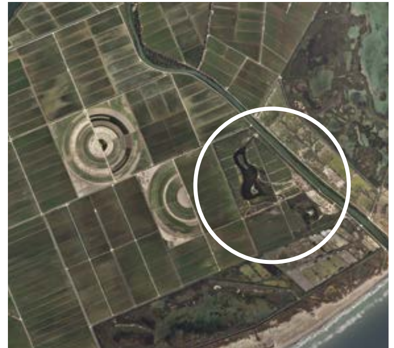
Abans i després de la recuperació de la llacuna de l'Alfacada a la Finca del Violí del delta de l'Ebre, Sant Jaume d'Enveja