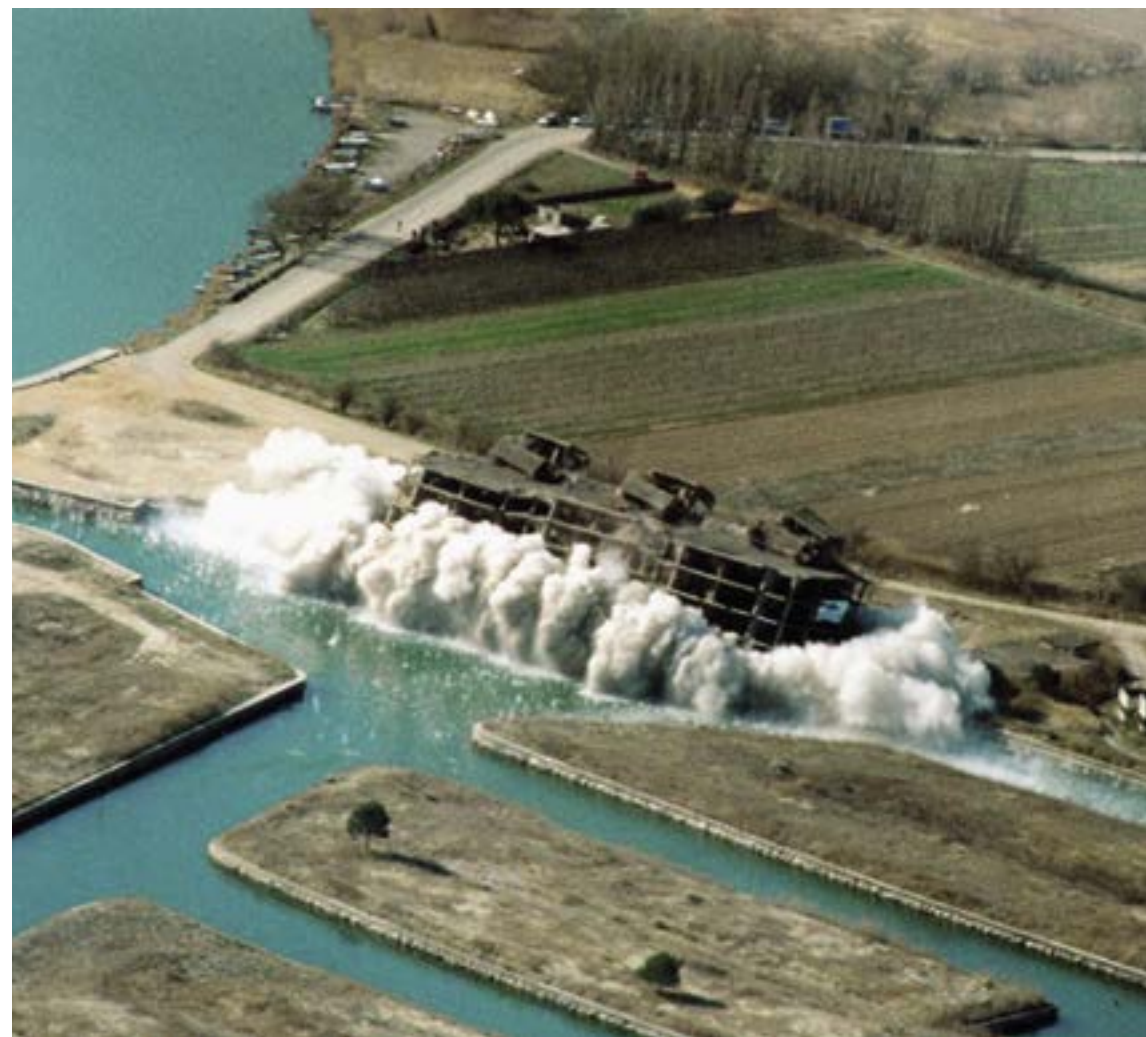
Imatges de la demolició de l'edifici a Fluvià Nàutic

director urbanístic (PDU) del litoral gironí. Tot plegat demostra que la pressió urbanitzadora sobre el litoral català i la batalla de les administracions i institucions com l'INCASÒL per a la seva preservació segueix sent molt viva i complexa.