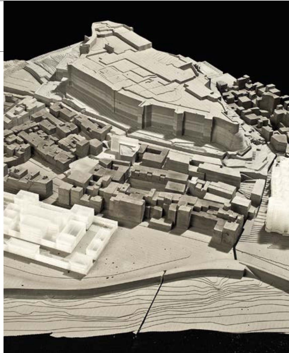
Transformació urbana del barri de Sant Jaume de Tortosa. Arquitecte Jornet Llop Pastor

De vegades, petites actuacions estratègiques, per acumulació, tenen la capacitat de millorar barris que presenten mancances o dinàmiques de degradació. Els set barris de la serra d'en Mena, a cavall entre Santa Coloma de Gramenet i Badalona, ocupen un vessant muntanyós amb forts pendents que dificulten l'accessibilitat i tenen una alta densitat. Aquests barris han patit una visible degradació física, un deteriorament de l'activitat econòmica i problemes socials derivats de les altes taxes d'atur i població en risc d'exclusió. L'objectiu del programa que impulsa l'INCASÒL és vertebrar els barris a través de múltiples intervencions de naturaleses molt diverses. Una d'aquestes actuacions preveu la connexió entre els carrers de Liszt i de Joan Vantín Escalas. És una actuació de renovació del teixit urbà que consisteix en l'obertura d'un nou espai públic, la plaça d'Alfonso Comín, que permet la connexió dels carrers, tot produint nous espais lliures públics amb una nova plaça, l'enderroc de 95 habitatges en mal estat i la construcció de 122 habitatges protegits on es reallotgen els veïns.