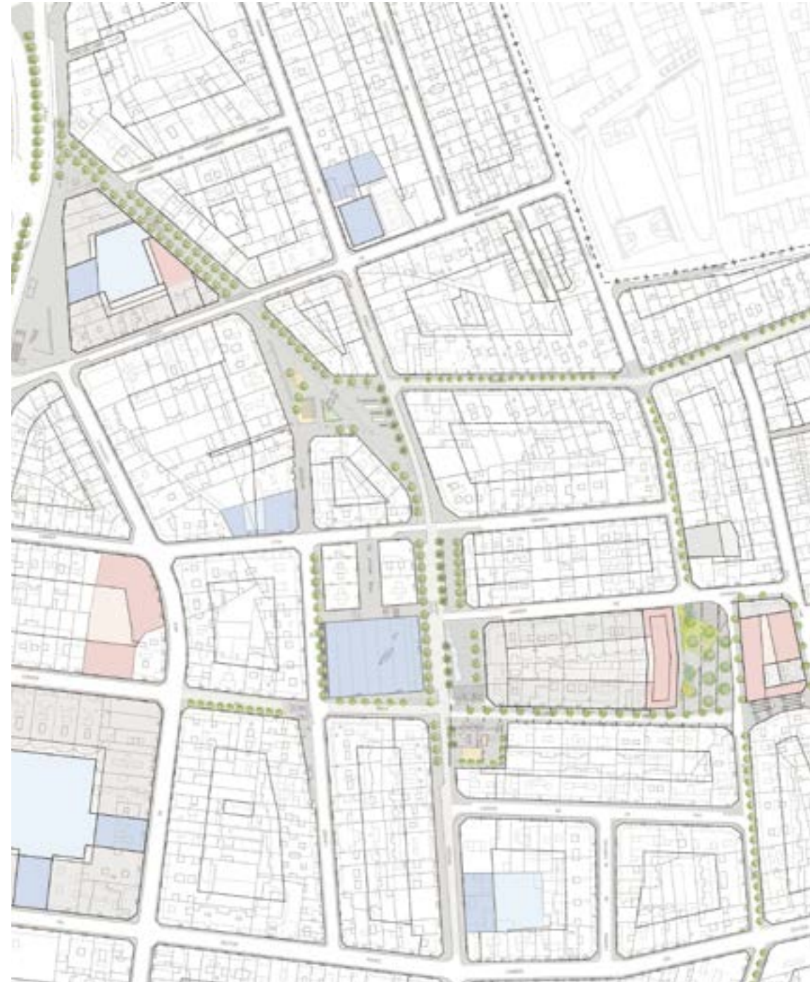
Projecte de renovació urbana dels barris de la Serra d'en Mena a Santa Coloma de Gramenet. Eix Bruc i connexió Valentí Escaleras