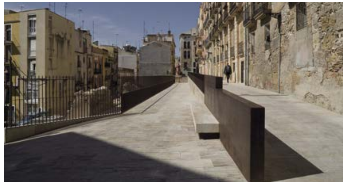
Espais públics del carrer Enrajolat de Tarragona