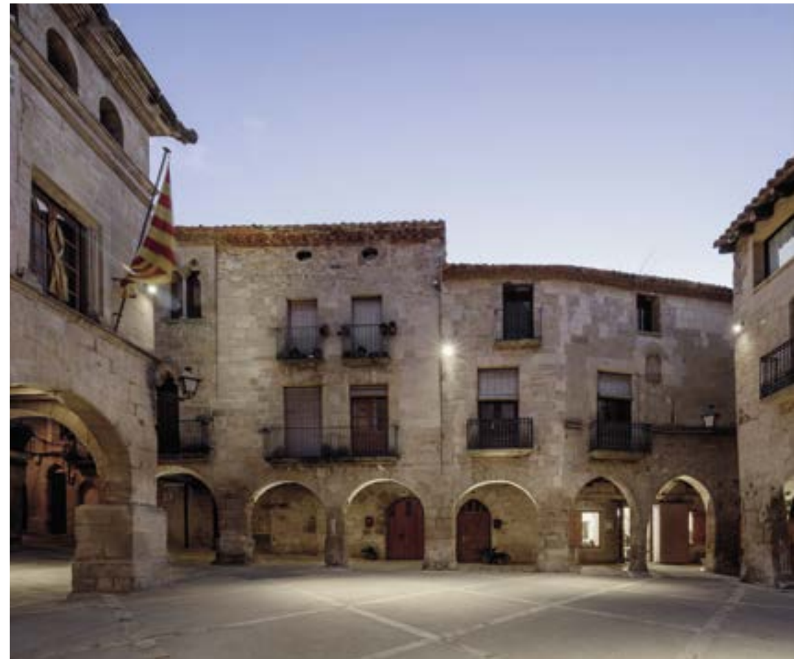
Rehabilitació dels carrers i places del nucli històric d'Horta de Sant Joan

constructiu i formal per al conjunt del nucli. La proposta, d'alta qualitat arquitectònica i gran rigor històric, combina només dos materials que permeten entendre les dues ànimes del municipi. La vila medieval i el turó andalusí es diferencien pel seu traçat diferent (el primer més regular i el segon més orgànic) i s'expliquen a través del diàleg dels dos tipus de paviment: de peça petita i adaptable per als traçats sinuosos andalusins o estenent grans catifes ortogonals de pedra per a les places i els carrers de la vila medieval.