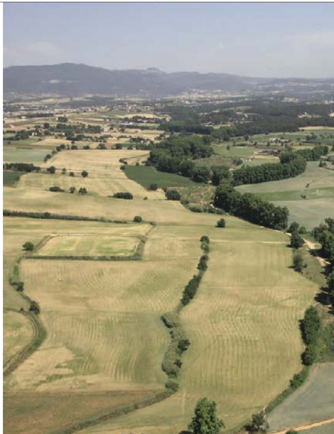
Imatge: Vista aèria de Gallecs

Gallecs no és l'únic espai inicialment qualificat d'urbà que l'INCASÒL ha ajudat a preservar: la Platja Llarga de Vilanova i la Geltrú també estava destinada a ser urbanitzada i, gràcies a una permuta de terrenys en altres indrets amb la propietat es va poder destinar aquest espai a parc públic, allunyat de l'edificació de la línia de platja i es va preservar un espai d'aiguamolls i un dels pocs espais agraris mediterranis, a primera línia marítima, de la costa central catalana.