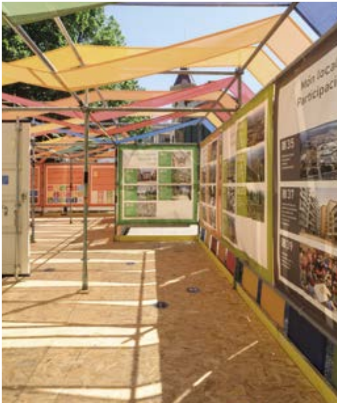
Manresa, jardins del Casino.