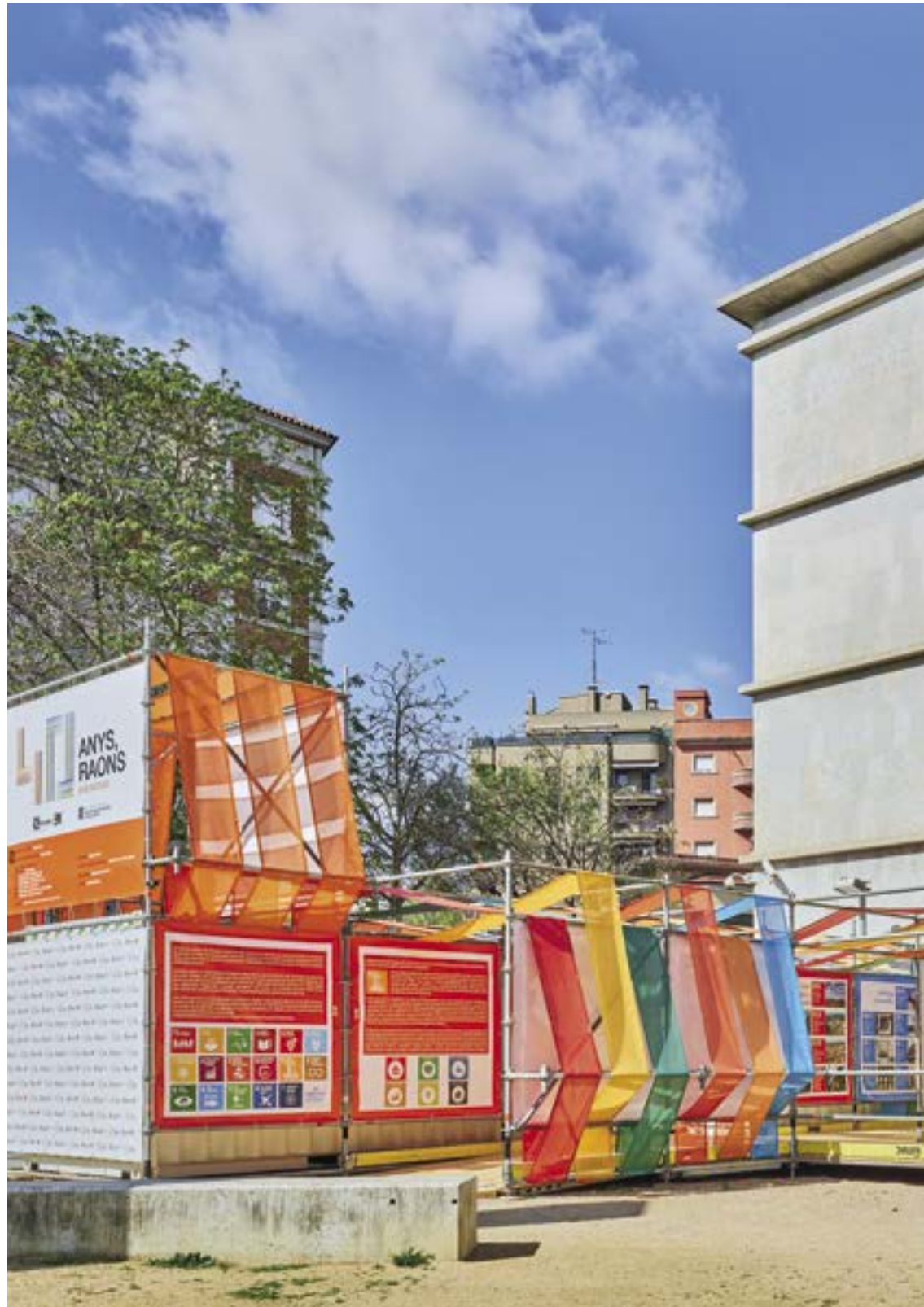
Girona, passatge d'Emili Blanch i Roig (al costat de la delegació de la Generalitat)