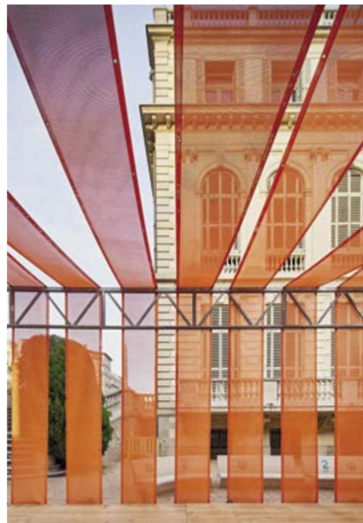
Barcelona, jardins del Palau Robert